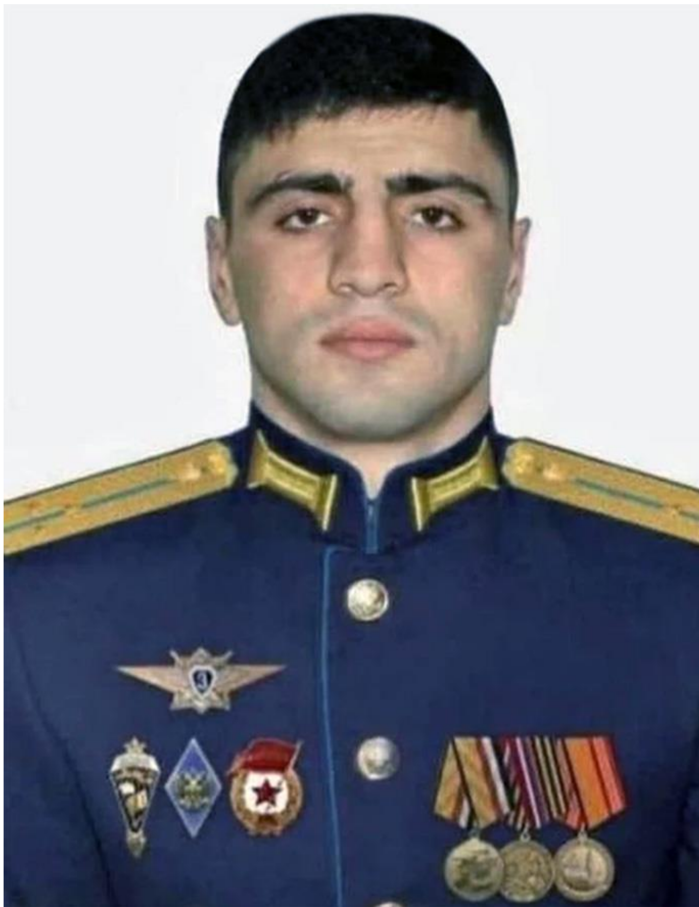
СТАРШИЙ ЛЕЙТЕНАНТ НУРМАГОМЕД ГАДЖИМАГОМЕДОВ.